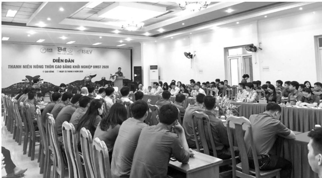
Diễn đàn thanh niên nông thôn Cao Bằng khởi nghiệp đổi mới sáng tạo năm 2020.

Ngày 26/11/2020, Tỉnh Đoàn Cao Bằng phối hợp với Sở Khoa học và Công nghệ tổ chức Cuộc thi Dự án khởi nghiệp sáng tạo thanh niên nông thôn tỉnh Cao Bằng. Thông qua Cuộc thi đã tìm kiếm được nhiều dự án khởi nghiệp sáng tạo thiết thực, hiệu quả, có tính khả thi cao trên thực tế như: Mô hình trồng dưa lê trong nhà lưới, Nhân giống, sản xuất chọn lọc chim trĩ đỏ gắn với chuỗi giá trị sản phẩm, Chăn nuôi gà không phao câu (Cáy