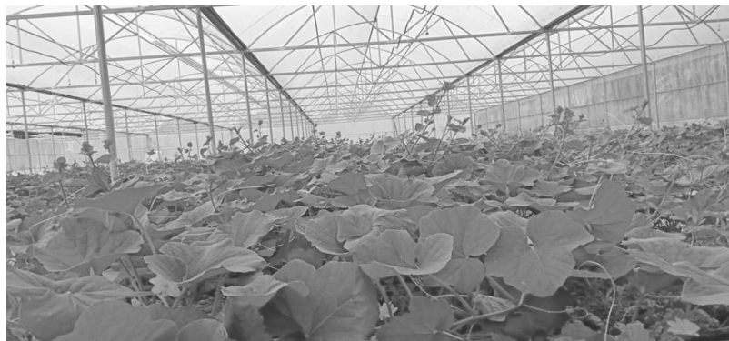
Dưa lê ra hoa tại mô hình.

Thị trấn Bảo Lạc là trung tâm kinh tế - văn hóa - xã hội của huyện Bảo Lạc, thị trấn tập trung hơn 4.000 người với tổng diện tích đất tự nhiên hơn 1.400 ha nằm trong vùng khí hậu nhiệt đới gió mùa, thích hợp với nhiều loại dưa như: Dưa hấu, dưa chuột, dưa lê,... Trong những năm gần đây, hoa quả nhiễm khuẩn, không đạt chất lượng an toàn vệ sinh thực phẩm đã gây tâm lý hoang mang tới người tiêu dùng. Với mong muốn tạo ra nguồn hoa quả an toàn, đảm